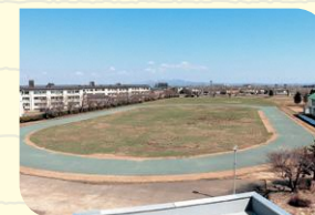
陸上トラック・多目的グラウンド