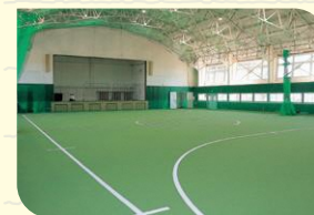
全天候型屋内グラウンド(体育館)

また、子どもからご高齢の方まで、幅広い世代や障がいがある方も楽しみながら運動できる、さまざまなスポーツ体験教室を開催する予定です。児童が楽しめる屋外トランポリン「ふわふわドーム」も設置しています。