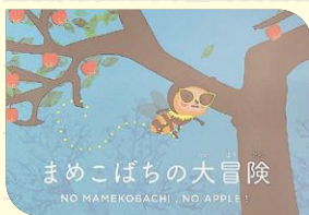
マメコバチゲーム