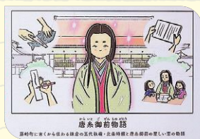
ヒストリールーム