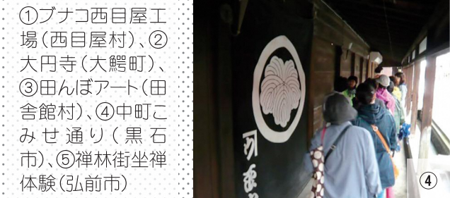
①ブナコ西目屋工場(西目屋村)、②大円寺(大鰐町)、③田んぼアート(田舎館村)、④中町こみせ通り(黒石市)、⑤禅林街坐禅体験(弘前市)