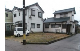
新潟県燕市(土地) 譲渡額約350万円