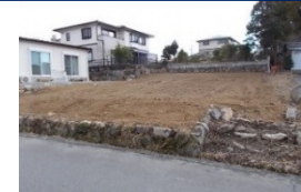
三重県津市(土地) 譲渡額約270万円