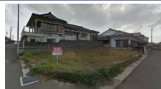
鹿児島県いちき串木野市(土地) 譲渡額約350万円