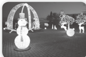
モニュメント広場を彩るイルミネーション