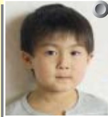
神 魁杜くん (中野目)