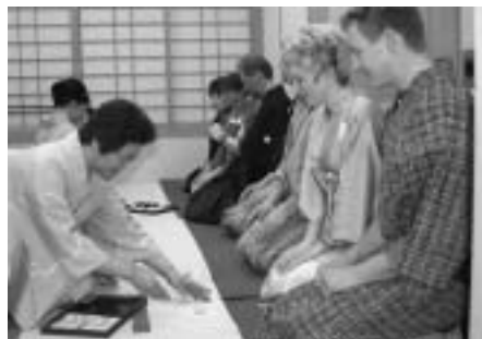
初めてのお茶の味は「にがかった」そうです