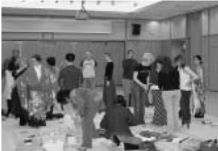
気に入った柄を選んで着付けてもらっていました

今年はベルギー、アメリカ、ドイツからカイトマスターなど7名が参加しました。日本の文化体験として着物や浴衣を着て茶道などを体験したり、藤崎小学校、藤崎中央小学校の児童と交流しました。4月29日にはライフコート平川で風揚げ大会が開催されました。