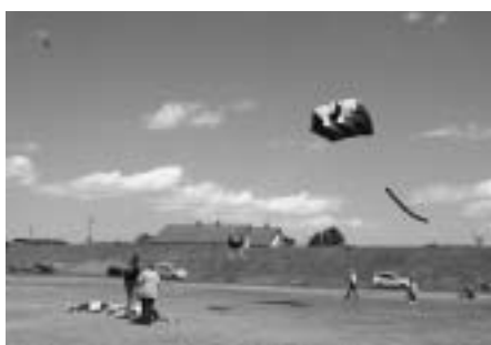
晴天と風に恵まれ、たくさんの凧が揚げられました