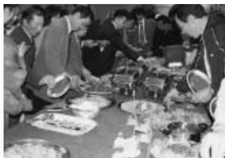
各国の料理がずらりと並んでいました