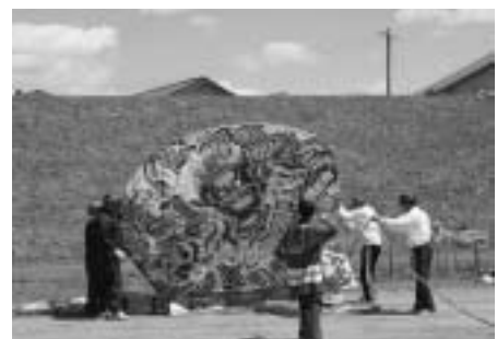
珍しい囃ねぶたの凧。揚げるのにひと苦労でした