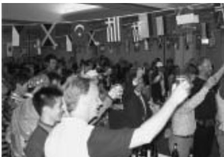
歓迎セッションには100名を超える町民が参加