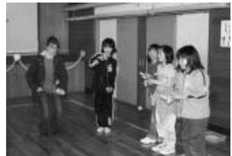
藤崎小学校では日本のおもちゃで一緒に遊びました