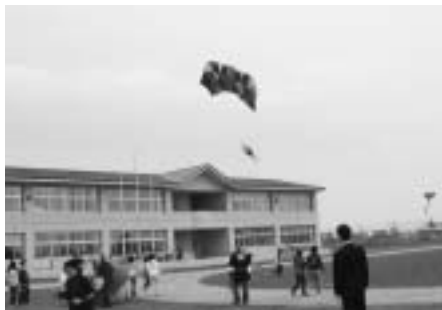
中央小学校ではたくさんの凧に歓声があがりました