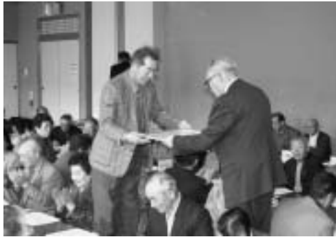
4月26日に行われた藤崎町老人クラブ連合会定時総会の様子です。 老人クラブに貢献した20名が表彰されました。