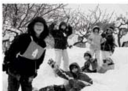
雪上ピンゴで悪戦苦闘

「新しい友達がいっぱいできて楽しかった。」という感想をたくさん子どもたちが残してくれた冬期野外研修でした。来年度もたくさん子どもたちが参加してくれることを期待したいと思います。