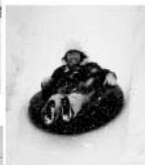
楽しかった チューブソリ