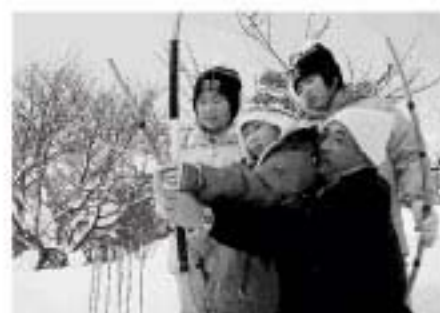
ロビンフットになれたかな?