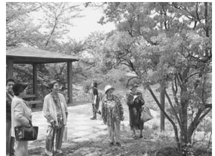
群馬県館林市から移植されたつつじ

「第30回大鰐温泉つつじまつり」が5月19日(土)から27日(日)まで、県立自然公園「茶臼山公園」で開催されます。 園内には、1万5000本のつつじが植栽され、公園頂上の