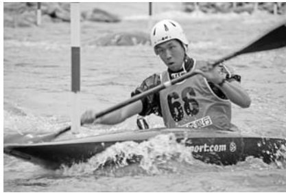
国内最高峰のカヌーは大迫力!