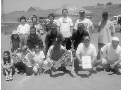
優勝した朝日町チーム

六月三日(日)に第三回町民体育大会・ソフトボール競技がライフコート平川(野球場・ソフトボール場)において開催され