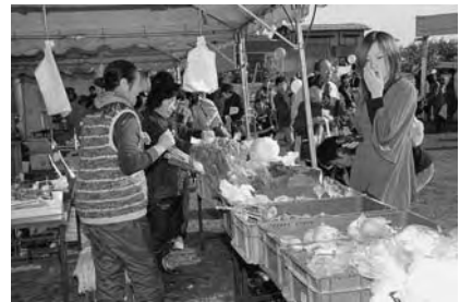
秋の味覚が堪能できます