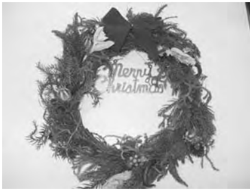
クリスマスリース

「クリスマスリースをつくる」いろいろな植物を使って、自然のクリスマスリースをつくります。(親子で協力し、一つのリースをつくります)