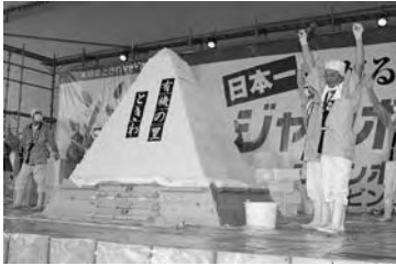
ジャンボおにぎり

藤崎町の十一月は祭り一色となります。今年から「藤崎町秋まつり」と名前を変え、さまざまなイベントが行われます。毎年恒例の「ジャンボおにぎりづくり」と「りんご競り市」には、町内外からたくさんの方が来場します。ぜひ会場へ足を運んでください。 ■第十九回ふじさきいきまつり・文化祭 ▼と き 十一月二日(金)・三日(土・祝)