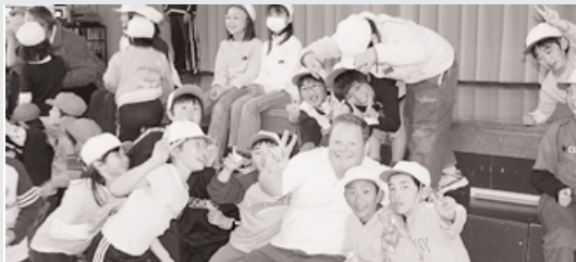
常盤小学校国際交流