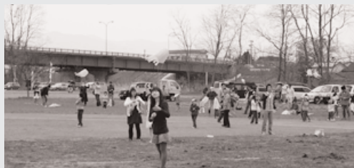
国際交流祭フェスタ