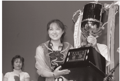
全国からのど自慢が集結

8月17日(日)、さるか荘で、「第14回櫻田誠一杯全国演歌大賞」が開催されます。この大会は、北島三郎の「北の漁場」や千昌夫の「望郷酒場」など数々のヒット曲を手が