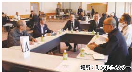
場所：町文化センター

町議会主催の「町民と語る会」が開催され、町議会議員と農業委員会が参加し、「農地の担い手・後継者問題」や「農地の有効活用・遊休農地対策」をテーマに活発な意見交換が行われました。会では、現場の声を共有しながら地域の未来について考える場となり、議員自身も農業について学ぶ貴重な機会となりました。