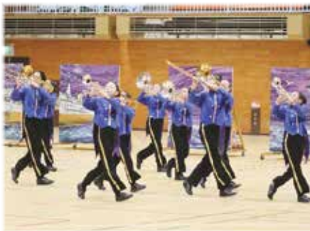
感謝演奏会では息の合った演奏で観客を魅了しました