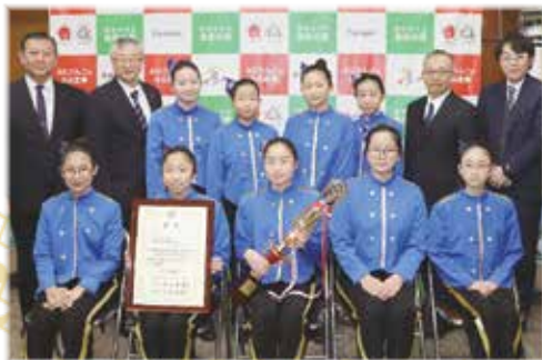
全国大会の結果報告のため来庁しました