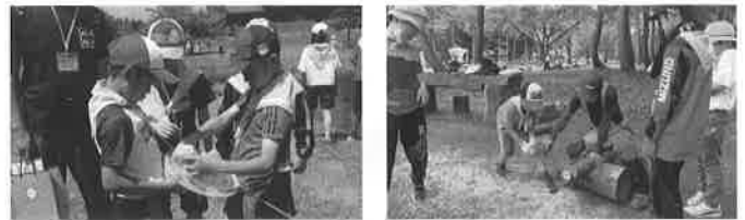
県内で緑の少年団交流会等を実施し、自然に親しみ、生態系や森林機能の仕組みについて学習