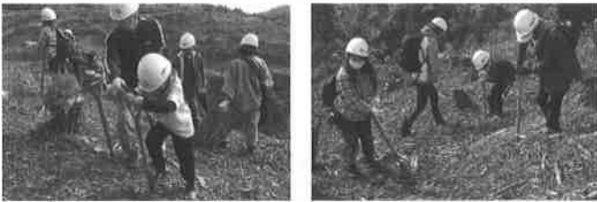
健全な森林づくりのため、植栽を始めとした各種森林整備の実施