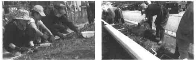
県内の学校・保育園・幼稚園・小公園・社会福祉施設等において、地域の方々と協力し花木等を植栽