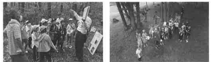
児童・生徒を対象に自然観察会や森林・林業教室を実施