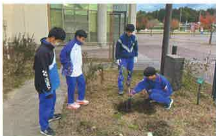
学校等公共施設の緑化推進

皆様方のご好意による緑の募金は、この法律に基づき、学識経験者等で構成される運営協議会で審議し、森林整備や緑化の推進、緑を通じた国際協力などに適切に活用されます。