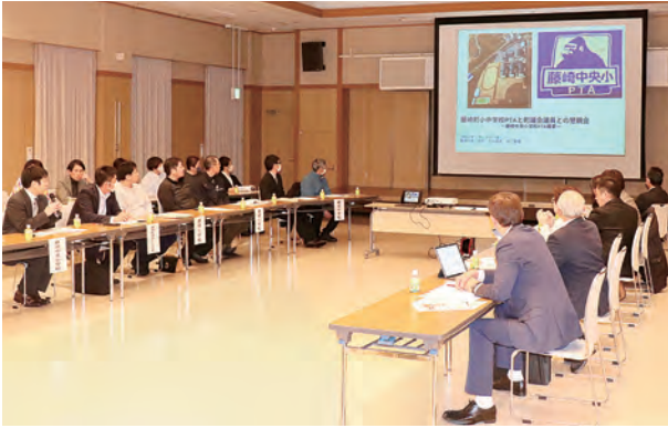
中央小の発表の様子。まずはPTAの現状認識から。