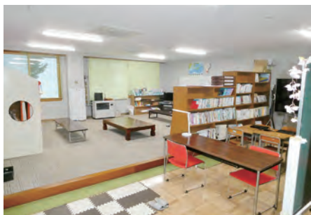
教育支援係で運営する、不登校の児童生徒が通う適応指導教室。

町では、不登校などの支援が必要な児童生徒に対応するため、新たに教育支援係を令和5年7月1日に設置し適応指導教室の運営を行っている