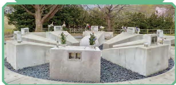
弘前市の墓地公園内にある合葬墓。 藤崎町の合葬墓はどんなデザインになるのか…気になる。