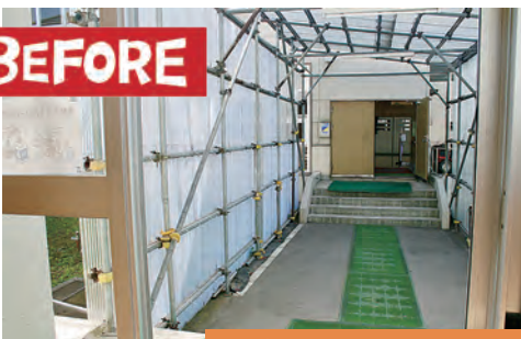
明德中学校改修工事