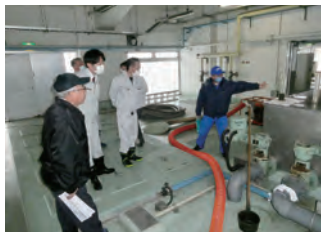
予想していたよりも臭いはしないのね