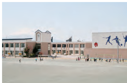
常盤小学校の昼休みの風景。子どもたちにはみんな元気に学校に通ってほしい。