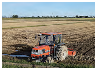
稲わらすき込み作業の様子。 (写真はイメージ)

稲刈りを終えた後すぐに土にすき込むことで分解されやすくなるが、経費がかさむことが普及しない理由のひとつとされている。