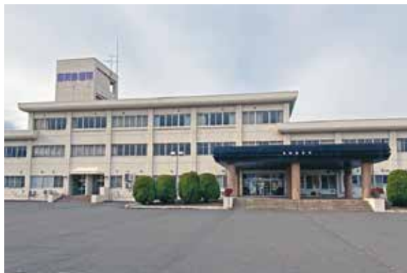
利活用プランが中断している旧藤崎診療所。町はなるべく早期に方向性を示すとしている。