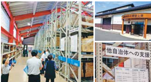
備蓄倉庫は体育館並みのデカさ！実践的な備蓄体制を整え、災害が発生した他の自治体にもいち早く救援物資を届けている

福島県相馬市を訪れ、津波で甚大な被害を受けた沿岸部や復興施設を見学し、防災への取り組みを学びました。市は海岸から1.5km離れた国道沿いに高さ7mの防波堤を築き、跡地には黒松を植えるなど、自然と共生する津波対策を進めています。また、震災時の教訓から「相馬兵糧蔵 ひょうりょうぐら 」という備蓄倉庫を建設し、発電機や食料を常備するなど、実践的な防災体制を整えています。