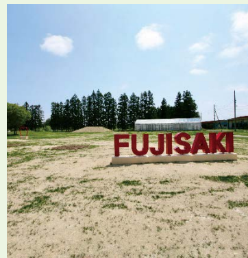
芝生はまだまだ成長途中