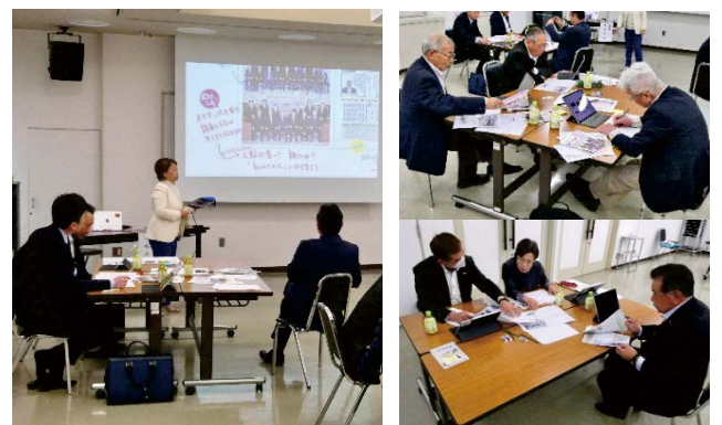
前号のクリニックはためになるねえ