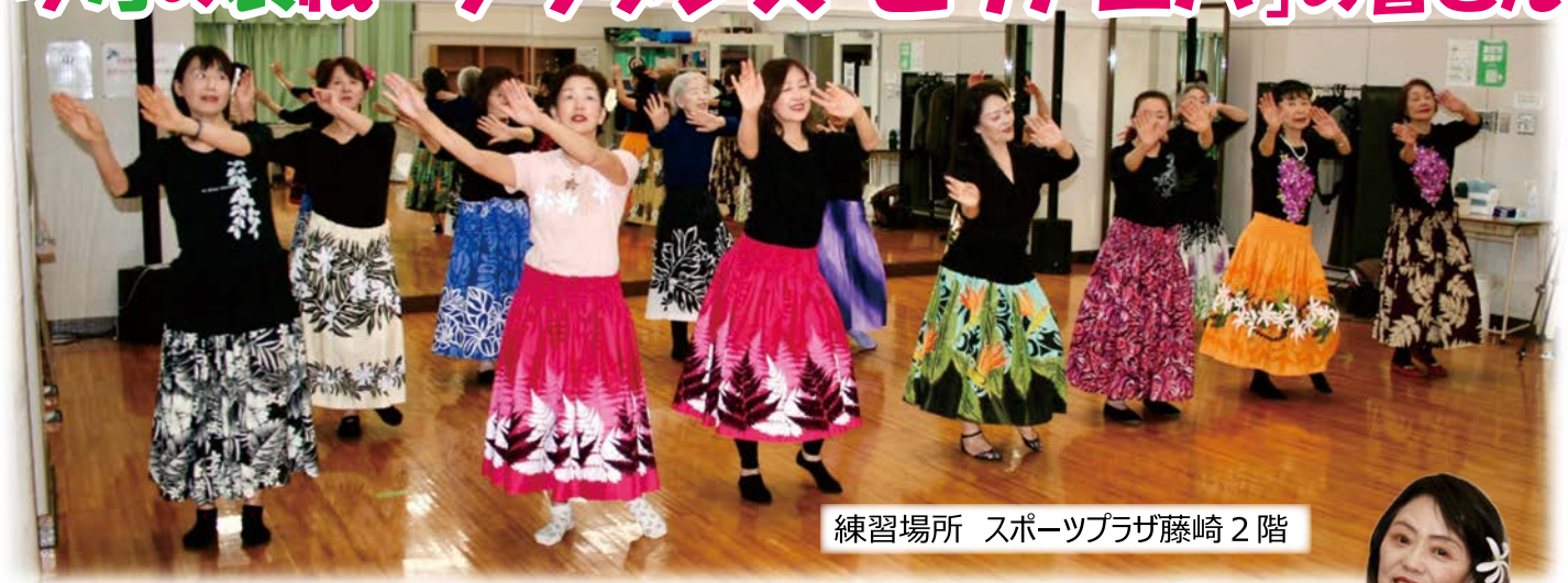
練習場所 スポーツプラザ藤崎 2階