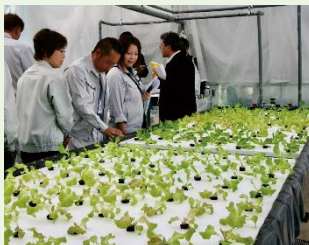
オープン前の農園を視察

観賞魚を養殖する水槽と葉物野菜を栽培する水耕ベッドがつながっており、魚と植物が支え合いながら成長していく資源循環型農法を学ぶことができる施設。まるで小さな地球を再現したかのよう。