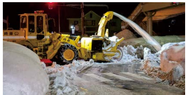
休日返上しても間に合わない（職員談）