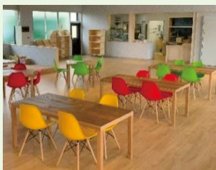
メニューがとても楽しみ

アクポニタウンで収穫したハーブやきのこなどの食材を使用し、ピザやハーブティなどを提供する。元は果樹貯蔵庫で、当時の雰囲気を感じながら藤崎産のマルシェを開催する。