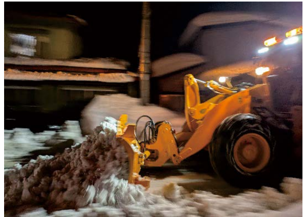
雪質がかわり苦労した除雪