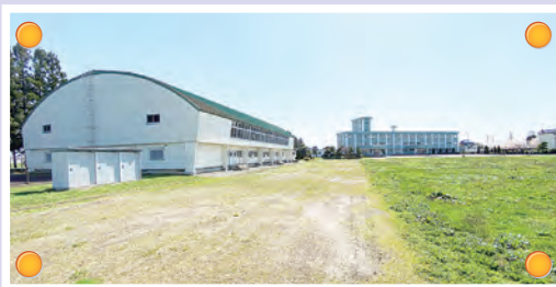
旧藤崎校舎及び体育館、グラウンド

体育館は全天候型トレーニングセンターとして床全面に人工芝フィールドを採用予定で、グラウンドは陸上トラック等として、再整備する予定です。