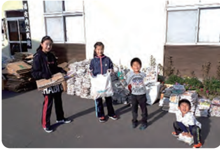
子ども会資源ごみ回収風景