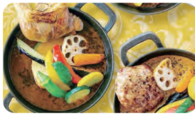
地元野菜入りスープカレー

地元野菜を食材に使用した2種類のカレーはバラエティに富んだトッピングで人気も上々です。