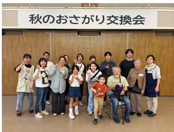
～令和7年9月開催時のスタッフの皆さんと～

今回も、おさがり交換に加え、無料の遊び場（グッド・トイ）を用意してお待ちしています。ぜひご家族そろって遊びに来てくださいね。