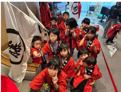
～昨年の活動の様子～