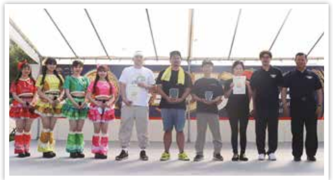
📷 受賞店舗で記念撮影!