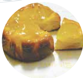
▲きくち覚誠堂 フロマージュ・ポム