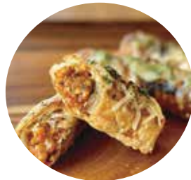
▲SPICY & CREAMY スープカレー屋さんがつくるキーマカレーパイ