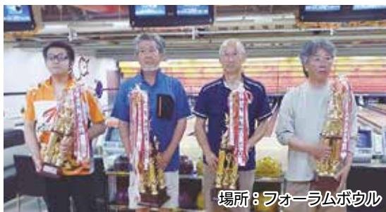
場所：フォーラムボウル

スポーツプラザ藤崎主催の町民ボウリング大会が開催され、26名の参加者が熱戦を繰り広げました。結果は次のとおりです。