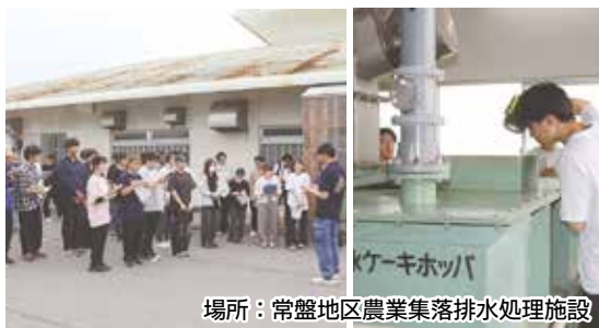
場所：常盤地区農業集落排水処理施設

弘前大学農学生命科学部地域環境工学科2年生40名が、普段学んでいる専門分野に関する知識を深めるため、福島徳下地区の農地と、常盤地区の農業集落排水処理施設を見学しました。